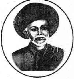
महात्मा ज्योतीबा फुले