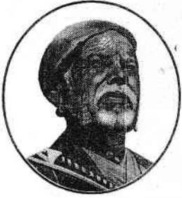
संत गाडगे बाबा