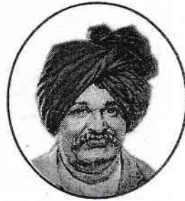
छत्रपती शाहू महाराज